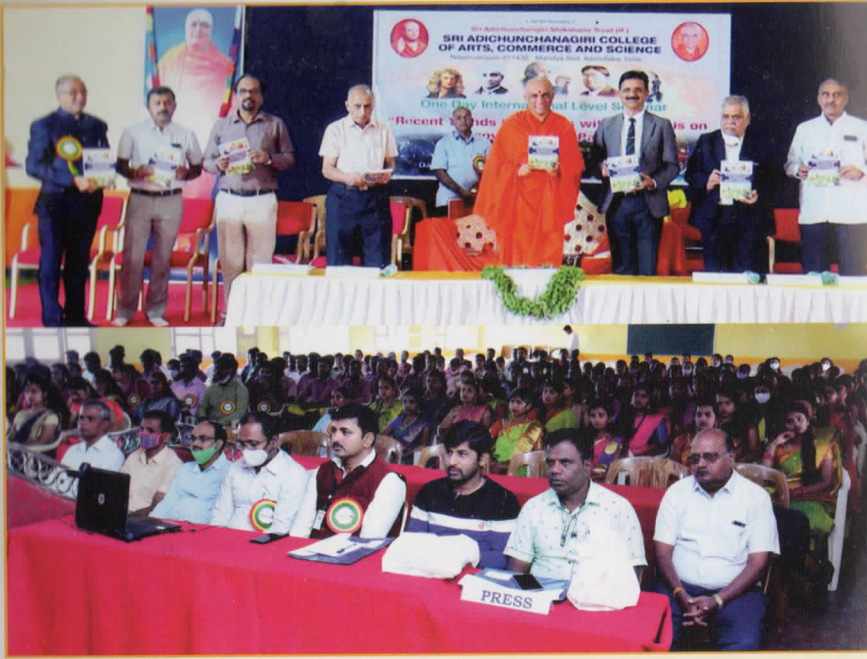
ಭೌತಶಾಸ್ತ್ರ ವಿಭಾಗ ವತಿಯಿಂದ ಏರ್ಪಡಿಸಿದ್ದ ಅಂತರರಾಷ್ಟ್ರೀಯ ವಿಚಾರ ಸಂಕಿರಣ