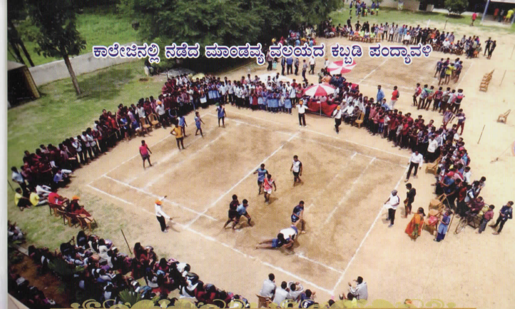
ಕಾಲೇಜಿನಲ್ಲಿ ನಡೆದ ಮಾಂಡವ್ಯ ವಲಯದ ಕಬ್ಬಡಿ ಪಂದ್ಯಾವಳಿ