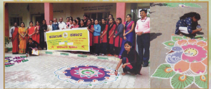
ಪರಂಪರಾ ಕೂಟದ ವತಿಯಿಂದ ಏರ್ಪಡಿಸಿದ್ದ ರಂಗೋಲಿ ಸ್ಪರ್ಧೆ