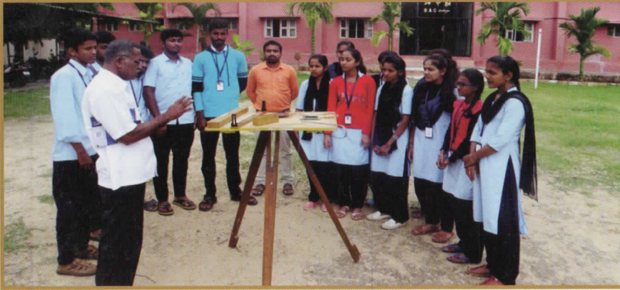
ಭೂಗೋಳಶಾಸ್ತ್ರ ವಿಭಾಗದ ವಿದ್ಯಾರ್ಥಿಗಳಿಗೆ ಪ್ರಾಯೋಗಿಕ ವಿವರಣೆ