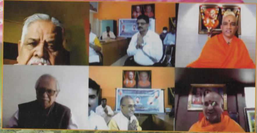
ನುಡಿನಮನ ಮತ್ತು ರಾಜ್ಯಮಟ್ಟದ ಅಂತರ್ಜಾಲ ಕವಿಗೋಷ್ಠಿ ಕಾರ್ಯಕ್ರಮ