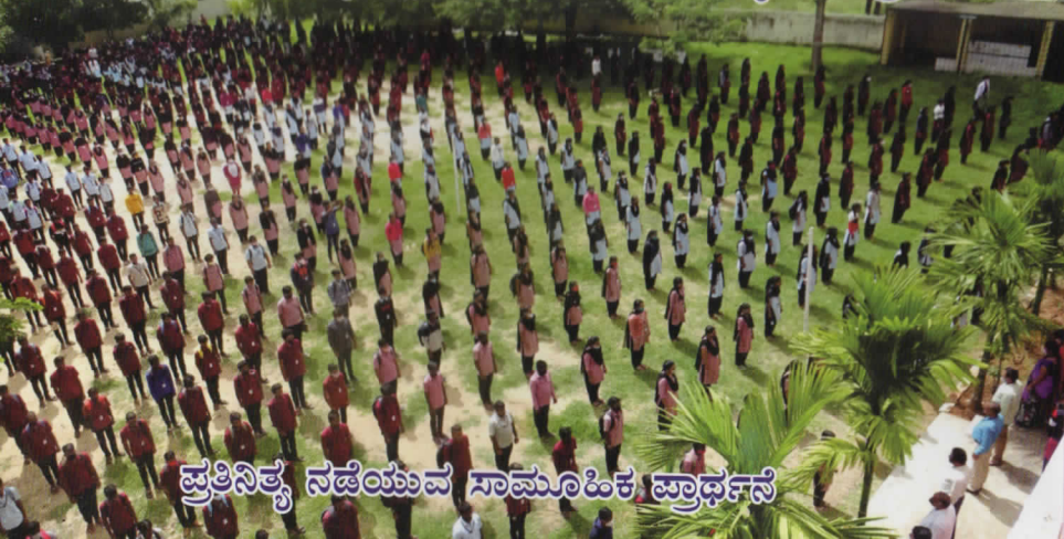
ಪ್ರತಿನಿತ್ಯ ನಡೆಯುವ ಸಾಮೂಹಿಕ ಪ್ರಾರ್ಥನೆ