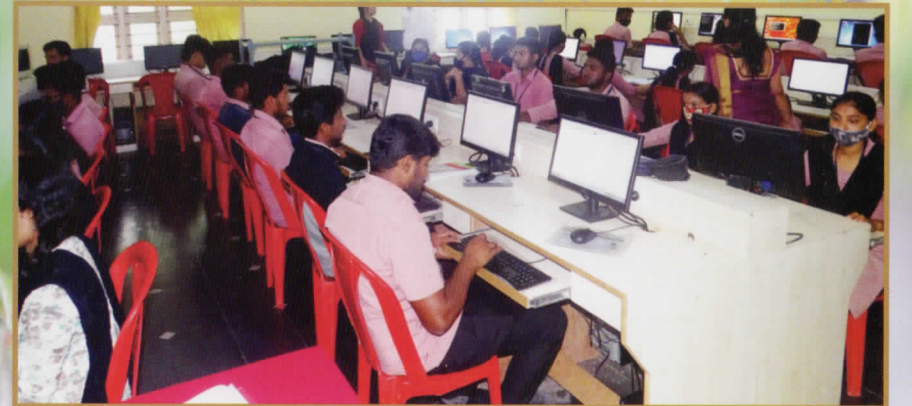
ಕಂಪ್ಯೂಟರ್ ಲ್ಯಾಬ್‌ನಲ್ಲಿ ಅಧ್ಯಯನನಿರತ ವಿದ್ಯಾರ್ಥಿಗಳು