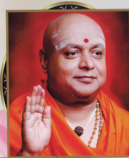
ಭೈರವೈಕ್ಯ ಪರಮಪೂಜ್ಯ ಜಗದ್ಗುರು ಪದ್ಮಭೂಷಣ ಶ್ರೀ ಶ್ರೀ ಶ್ರೀ ಡಾ. ಬಾಲಗಂಗಾಧರನಾಥ ಮಹಾಸ್ವಾಮೀಜಿಯವರು ಸಂಸ್ಥಾಪಕ ಅಧ್ಯಕ್ಷರು, ಶ್ರೀ ಆದಿಚುಂಚನಗಿರಿ ಶಿಕ್ಷಣ ಟ್ರಸ್ಟ್ (ರಿ.)