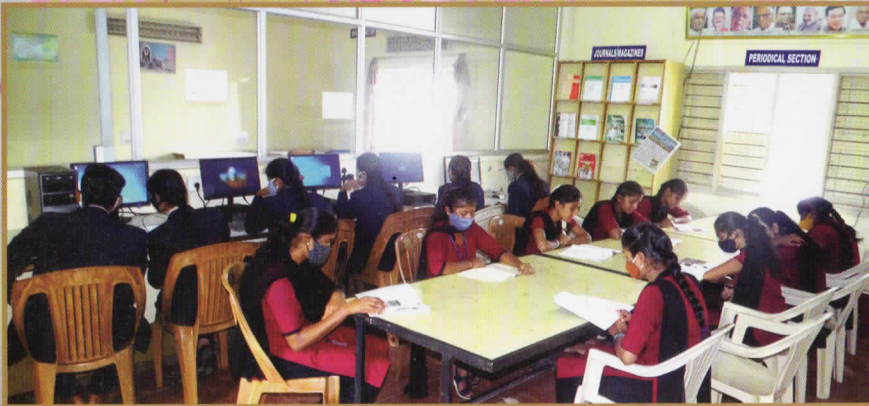
ಗ್ರಂಥಾಲಯದಲ್ಲಿ ಅಧ್ಯಯನಶೀಲ ವಿದ್ಯಾರ್ಥಿಗಳು