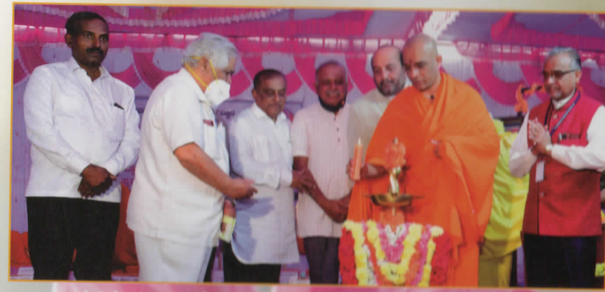
ಸಾಂಸ್ಕೃತಿಕ, ಕ್ರೀಡಾ ಮತ್ತಿತರ ಚಟುವಟಿಕೆಗಳ ಉದ್ಘಾಟನಾ ಸಮಾರಂಭ