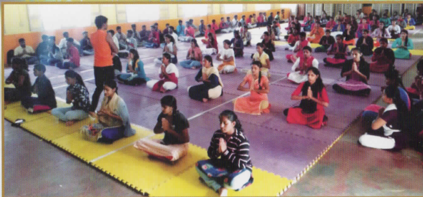
ಕಾಲೇಜಿನಲ್ಲಿ ನಡೆದ ಯೋಗ ಕಾರ್ಯಕ್ರಮ