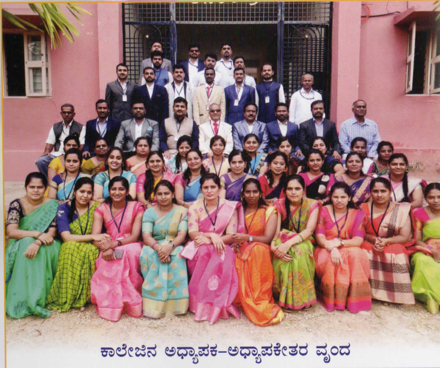
ಕಾಲೇಜಿನ ಅಧ್ಯಾಪಕ-ಅಧ್ಯಾಪಕೇತರ ವೃಂದ