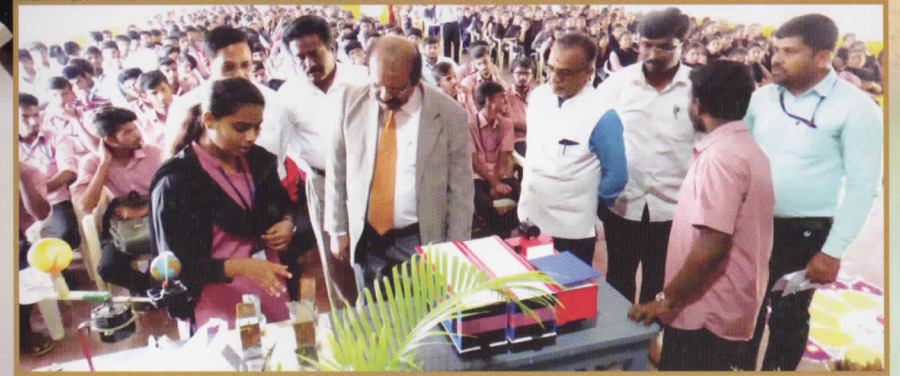
ವಿಜ್ಞಾನ ದಿನಾಚರಣೆ ಕಾರ್ಯಕ್ರಮದಲ್ಲಿ ವಿದ್ಯಾರ್ಥಿಗಳ ವಿಜ್ಞಾನ ಮಾದರಿಗಳ ಪ್ರದರ್ಶನ